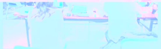
阎凤桥教授就学科发展进行汇报